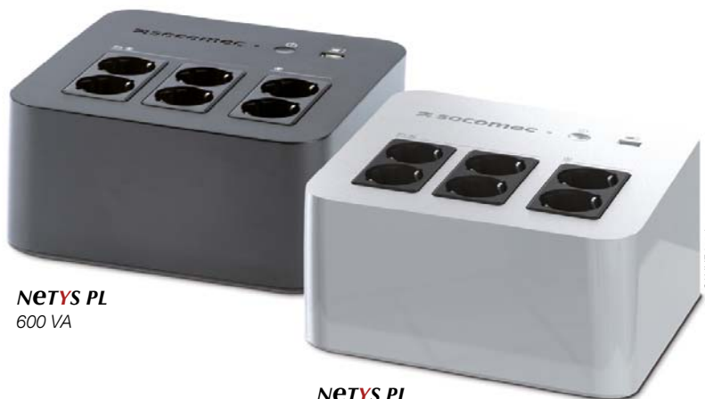
NETYS PL 600 VA